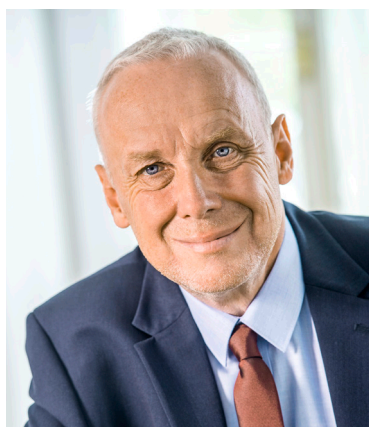
Ihr Bürgermeister / vaš župan Bernhard Sadovnik